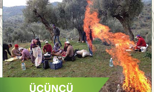
ÜÇÜNCÜ SELMA YILDIZ