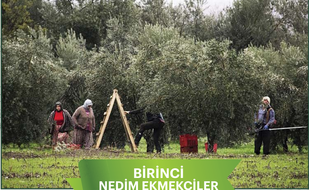
BİRİNCİ NEDİM EKMEKÇİLER